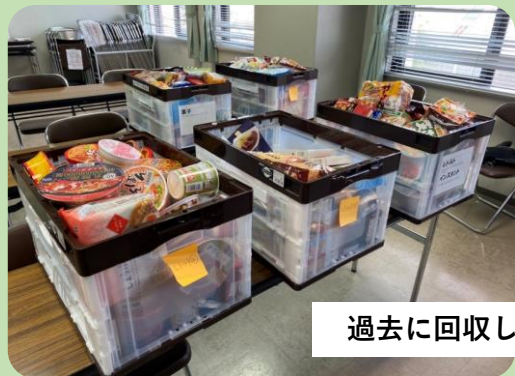
過去に回収した食品