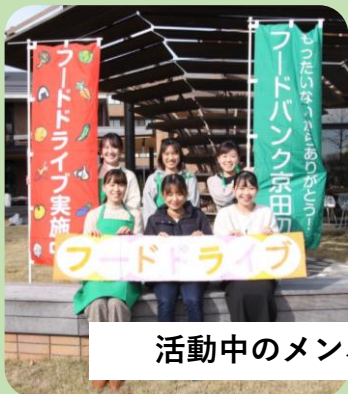
活動中のメンバー