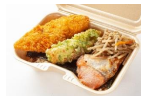
▲ 鮭が入ったのり弁