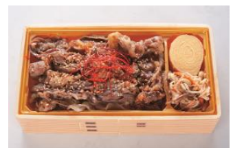
▲ 宮崎牛使用カルビ重