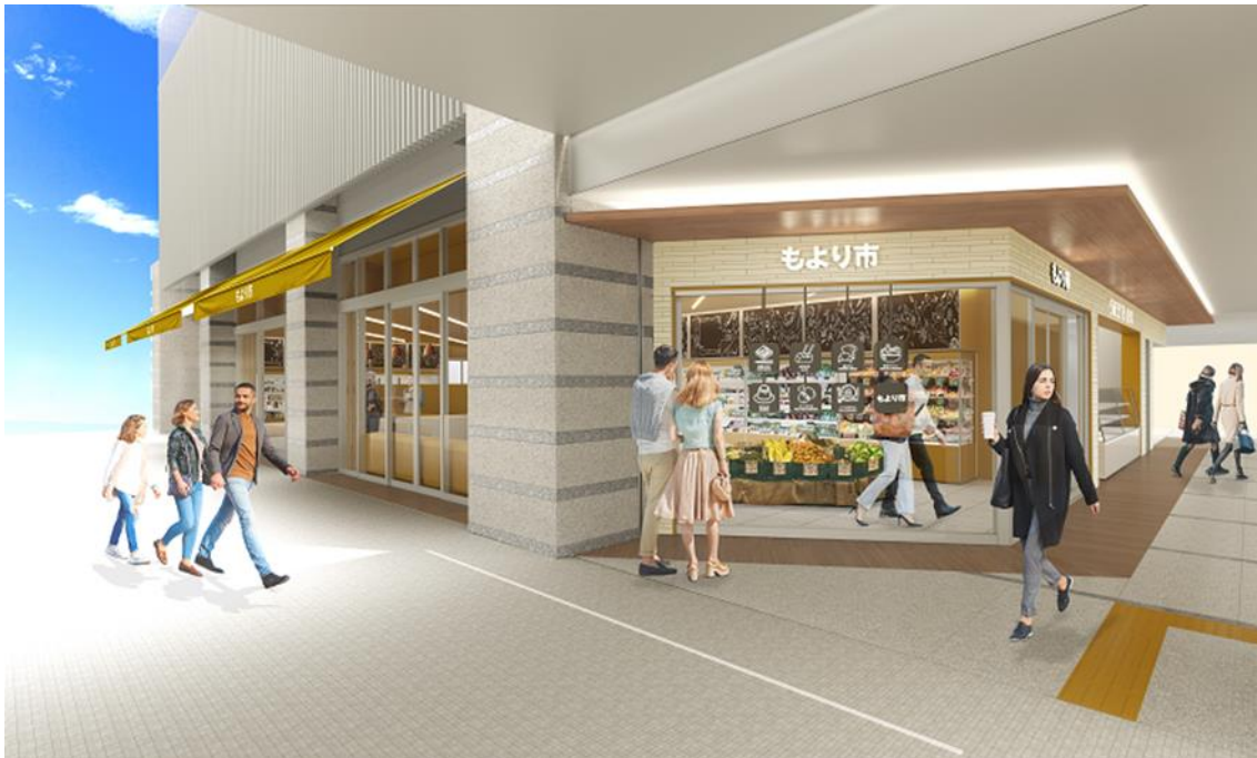
食の商店「もより市 樟葉駅」店舗イメージ