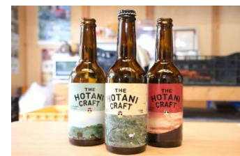
▲ カンパイクンパニー クラフトビール