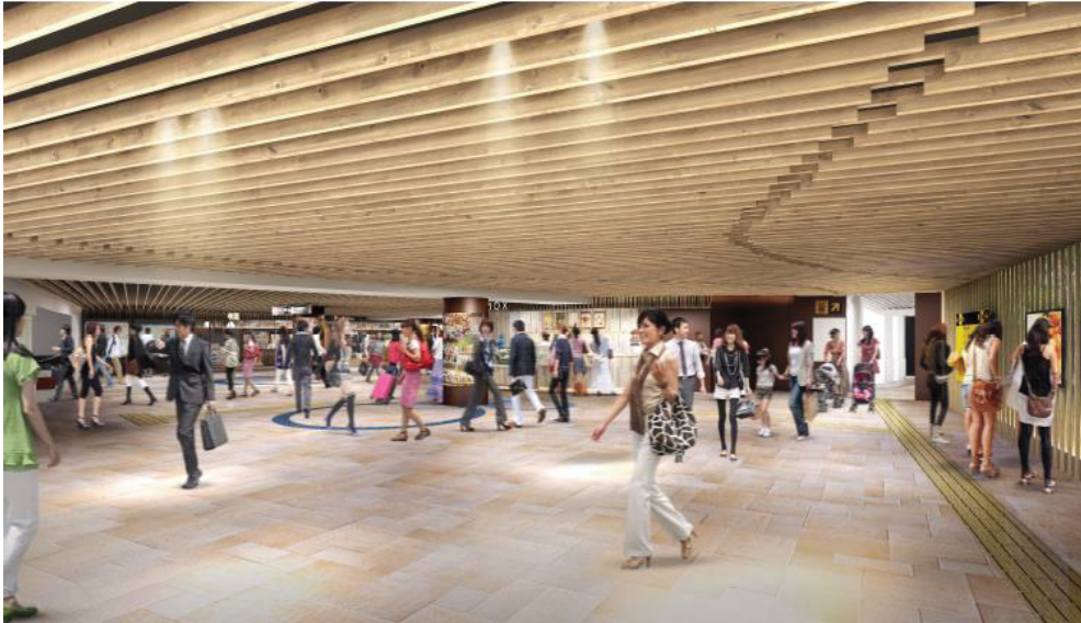
▲『新なにわ大食堂』(完成イメージ②)