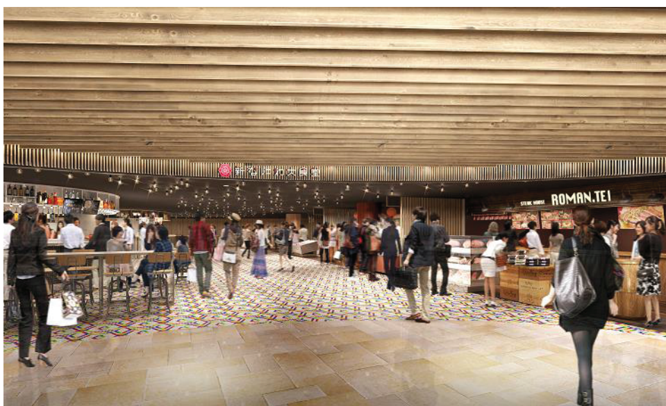
▲『新なにわ大食堂』(完成イメージ①)

※本日、大阪市交通局からも、本商業施設に関する発表が行われています。詳しくは大阪市交通局のホームページをご覧ください