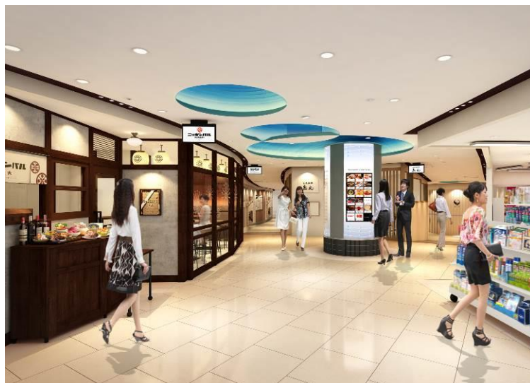
▲『パナンテ京阪天満橋』(イメージパース)