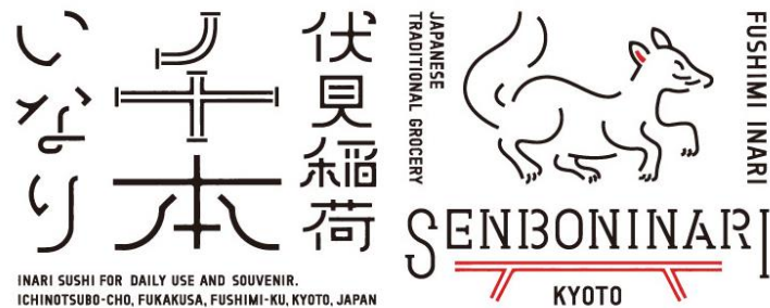
「伏見稲荷 千本いなり」ロゴ

店舗デザインおよび商品パッケージ等に使用するロゴのデザインは、先般、京阪グループに加わった株式会社カフェが制作。稲荷大神様の眷属である「白狐」と伏見稲荷大社の名所である「千本鳥居」をモチーフにしており、インバウンドのお客さまにも分かりやすく、国内観光のお土産としてもご利用いただけます。