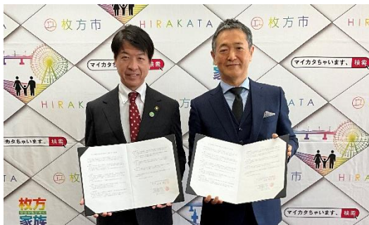
枚方市との締結式